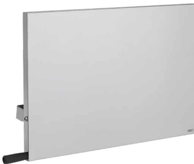
REFERENČNÍ VZHLED VÝROBKU